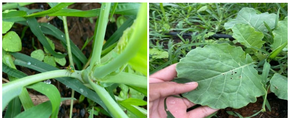
Figura 4 – Danos da Vaquinha brasileira na cultura da couve.

Por outro lado, o óleo de citronela e o detergente apresentaram maior redução de 60%, o que indica uma diminuição no ataque de D. speciosa , o que é consistente com estudos que apontam a citronela mais como repelente, e que o detergente, apesar de atuar na quebra da camada cerosa dos insetos, registrou redução do ataque foliar na cultura da couve. (Ferreira et al., 2017).