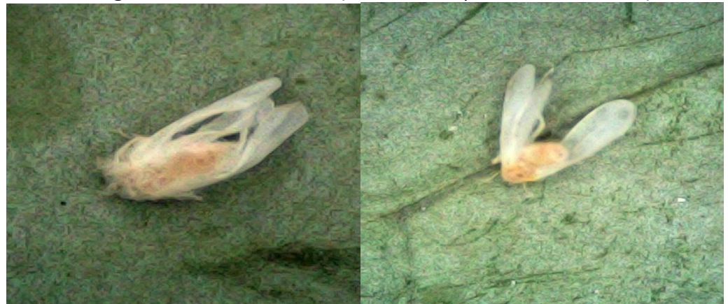
Imagem 3 – Mosca – Branca (Mortalidade pelo extrato de alho)

Segundo Plata-Rueda et al. (2017), o óleo essencial de alho e seus constituintes induziram sinais de intoxicação, necrose e até paralisia em insetos-praga, demonstrando que os compostos sulfurados do alho afetam o sistema nervoso e o metabolismo dos insetos.