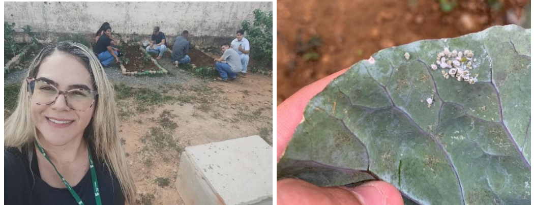
Imagem 2 – Identificação de Pragas e Doenças.

uso de insumos sintéticos e contribuindo para a saúde do solo. (MATOS et al., 2022)