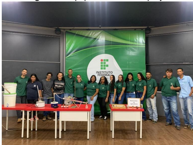
Imagem 1 – Equipe executora do projeto.

Primeiro passo deste projeto foi fazer o contato com as diretoras ou responsáveis pelas escolas, o que possibilitou uma conversa dinâmica sobre nosso propósito acadêmico e o retorno para a instituição. Contudo, sendo firmado entre as partes do projeto, demos início ao projeto.